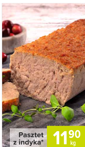
Paszтет z indyka*