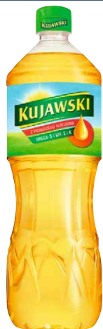
Olej KUJAWSKI 1 l