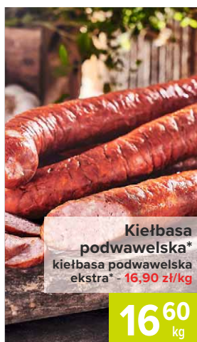
Kiełbasa podwawelska* kiełbasa podwawelska ekstra* - 16,90 zł/kg