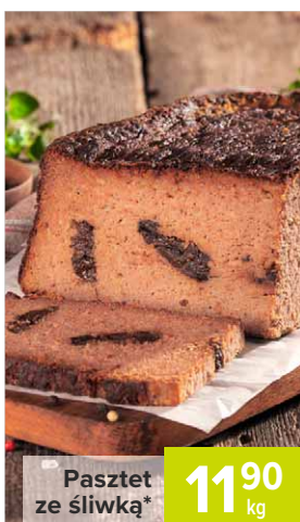
Paszтет ze śliwką*