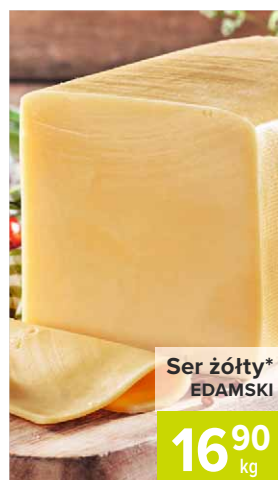
Ser żółty* EDAMSKI