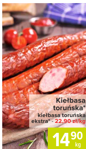
Kiełbasa toruńska* kiełbasa toruńska ekstra* - 22,90 zł/kg