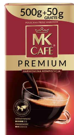
Kawa mielona MK CAFÉ PREMIUM 550 g 27,25/kg