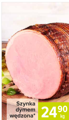
Szynka dymem wędzona*