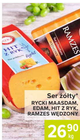
Ser żółty* RYCKI MAASDAM, EDAM, HIT Z RYK, RAMZES WĘDZONY