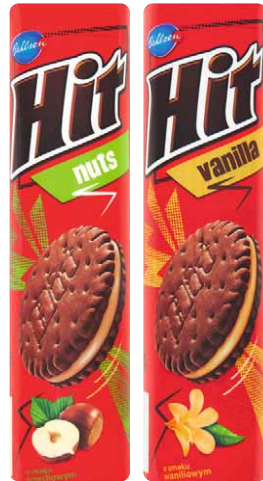
Markizy, ciastka HIT 220 g 4 rodzaje 1,63/100 g