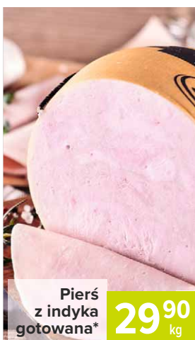
Piers z indyka gotowana*