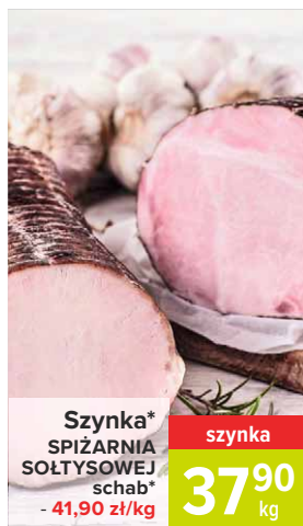
Szynka* SPIŻARNIA SOŁTYSOWEJ schab* - 41,90 zł/kg