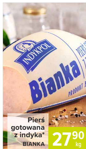
Piers gotowana z indyka* BIANKA