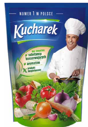
Przyprawa KUCHAREK 200 g 1,00/100 g