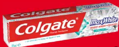
COLGATE MAX PASTA 125 ML • różne rodzaje 52600830