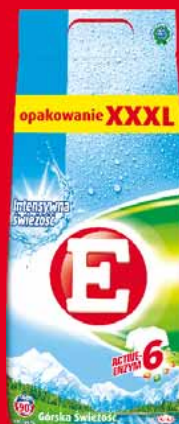
E PROSZEK 90 PRAŃ • dwa rodzaje 99223232