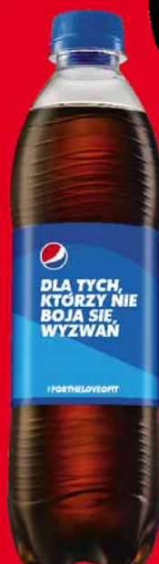
NAPOJE PEPSI 500 ML • różne rodzaje 48021653