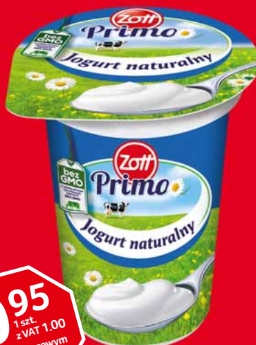
JOGURT NATURALNY 180 G 36366615