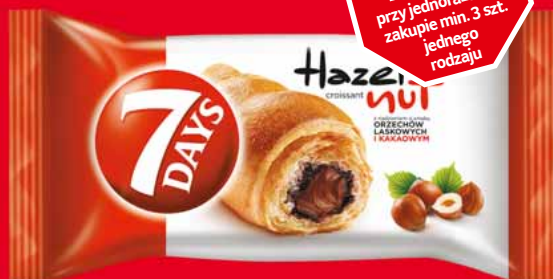
ROGAL 7 DAYS 60 G • różne rodzaje 52308129