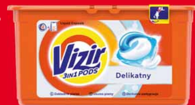
VIZIR KAPSUŁKI DO PRANIA 36 SZT., 38 SZT. • różne rodzaje 45718301