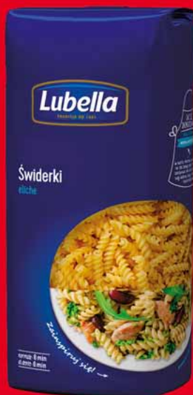
MAKARON 500 G • wybrane rodzaje 34434126

6 89 1 szt. z VAT 7.24 przy jednorazowym zakupie min. 2 szt. jednego rodzaju