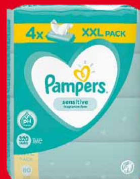
PAMPERS CHUSTECZKI NAWILŻANE XXL 4 x 80 SZT. • dwa rodzaje 63479315