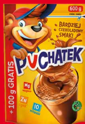
PUCHATEK 600 G 23294184