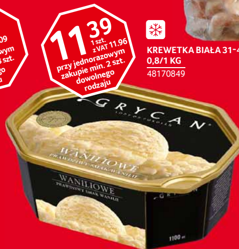
❄️ LODY 1,1 L • różne smaki 80322803