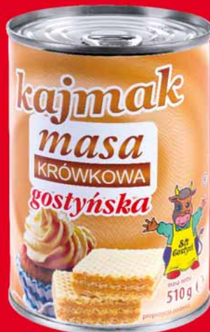
MASA KRÓWKOWA 510 G 32224388