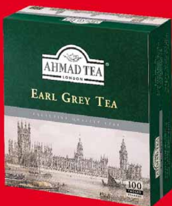
HERBATA EKSPRESOWA AHMAD 100 TOREBEK • różne rodzaje 95840146