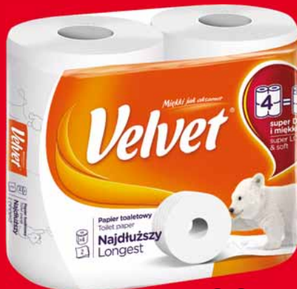
VELVET NAJDŁUŻSZY PAPIER TOALETOWY 4 ROLKI 50043439