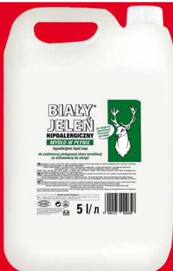
BIAŁY JELEN MYDŁO W PŁYNIE 5 L 68838051