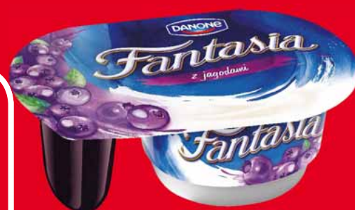
JOGURT FANTASIA 100-122 G 32597130