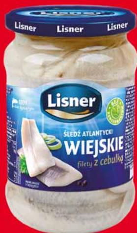
FILETY ŚLEDZIOWE WIEJSKIE 600 G 88044995