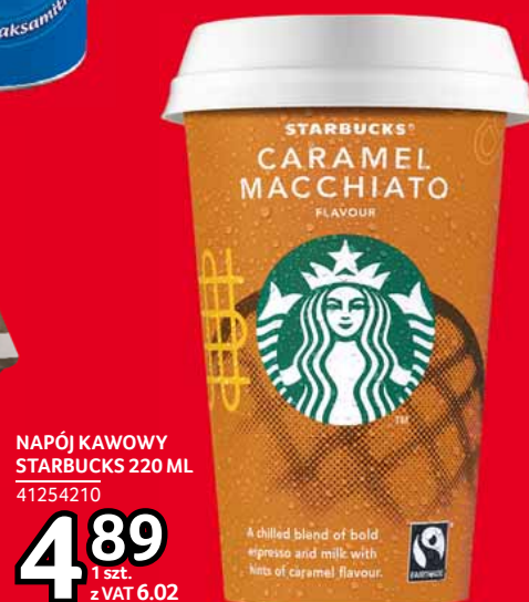
NAPÓJ KAWOWY STARBUCKS 220 ML 41254210