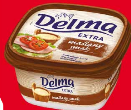
DELMA 450 G • wybrane rodzaje 91602896