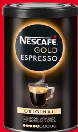
KAWA ROZPUSZCZALNA NESCAFÉ GOLD ESPRESSO 95 G • różne rodzaje 61106126