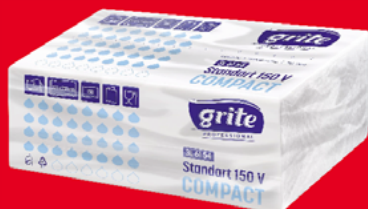
GRITE RĘCZNIK SKŁADANY 150 LISTKÓW 54579776