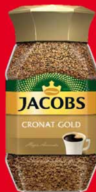
KAWA ROZPUSZCZALNA JACOBS CRONAT GOLD 200 G 68288471