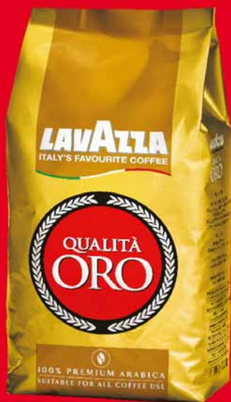
KAWA ZIARNISTA LAVAZZA QUALITA ORO 1 KG 43222983