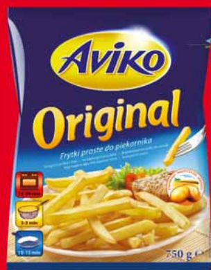
❄️ FRYTKI 750 G • proste, karbowane 59704635