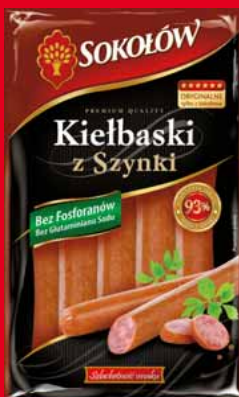
KIELBASKI Z SZYNKI 250 G 40146623

4 99 1 szt. z VAT 5.24 przy jednorazowym zakupie min. 3 szt. z rodzaju