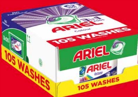
ARIEL KAPSUŁKI DO PRANIA 3 x 35 SZT. • dwa rodzaje 60521192