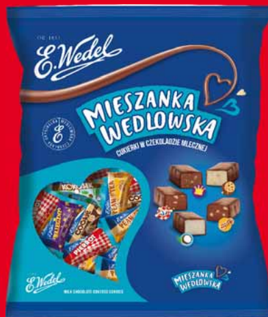
MIESZANKA WEDŁOWSKA 3 KG • klasyczna, mleczna 65649014