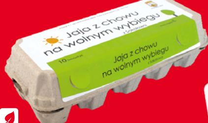
❄️ JAJA Z CHOWU NA WOLNYM WYBIEGU KL. L • sprzedaż po 10 szt. 63006704