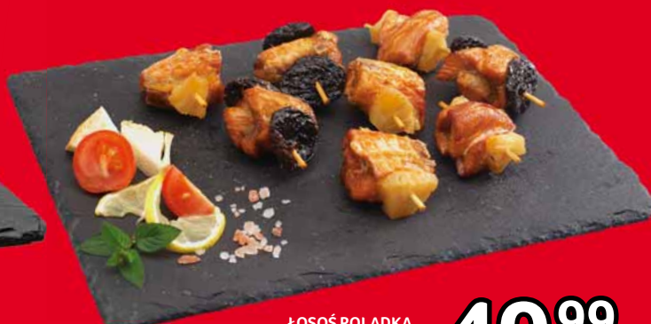
ŁOSOŚ ROLADKA • różne rodzaje 56600265