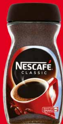
KAWA ROZPUSZCZALNA NESCAFÉ CLASSIC 200 G 64567381