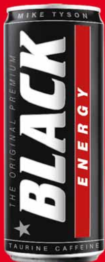
NAPOJE ENERGETYCZNE BLACK 250 ML • różne rodzaje 77817674