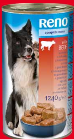
RENO 1240 G • dwa rodzaje 17575812