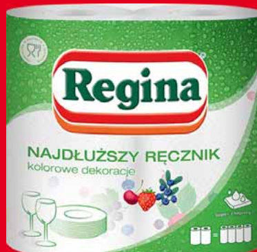
REGINA RĘCZNIK NAJDŁUŻSZY 2 ROLKI • dwa rodzaje 15018419