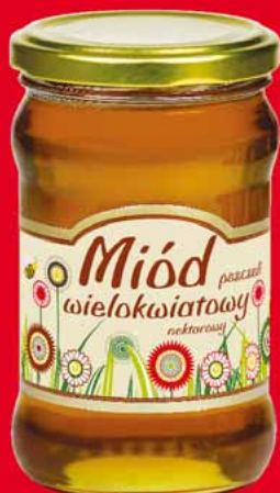
MIÓD WIELOKWIATOWY 370 G 34564096