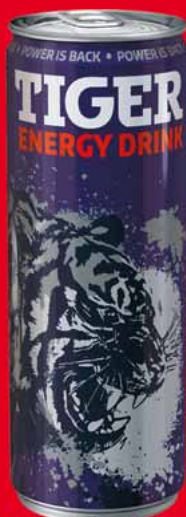
NAPOJE ENERGETYCZNE TIGER 250 ML • różne rodzaje 50307891