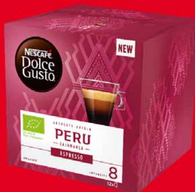
DOLCE GUSTO 12/16 KAPSUŁ • różne rodzaje 46260295