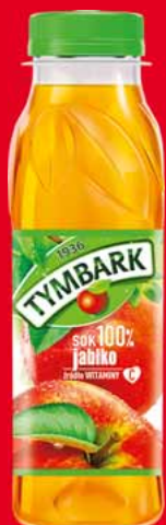
SOKI I NEKTARY TYMBARK 300 ML • różne smaki 59718817