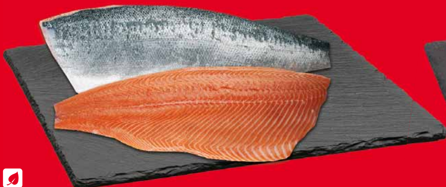
ŁOSOŚ FILET ZE SKÓRĄ D-TRYM 51310340