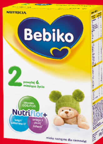
BEBIKO 350 G • 2, 3, 4 76380773