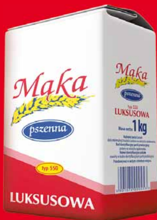
MAKA LUKSUSOWA 1 KG 31008774