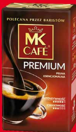
KAWA MIELONA MK PREMIUM 500 G 82190232