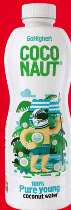
WODA KOKOSOWA COCONAUT 1 L 35163765