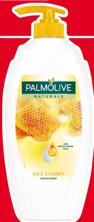
PALMOLIVE ŻEL POD PRYSZNIC 750 ML • różne rodzaje 24455362