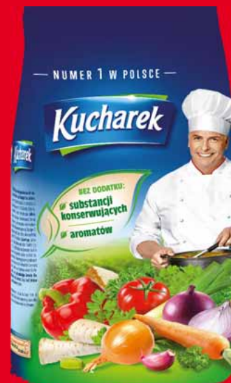
KUCHAREK 1 KG 74538703