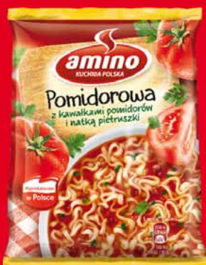
ZUPA • wybrane rodzaje 24516064