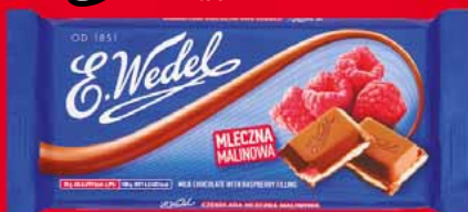
CZEKOLADA 90/100 G • różne rodzaje 35015387