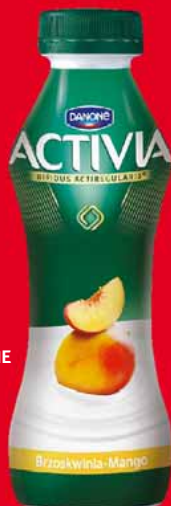
ACTIVIA DO PICIA 280 G 30825210