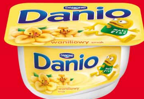
SEREK DANIO 135-140 G • różne smaki 34360503