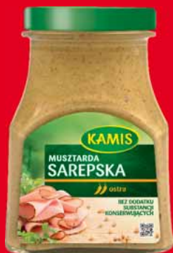
MUSZTARDA 185 G • wybrane rodzaje 35366665