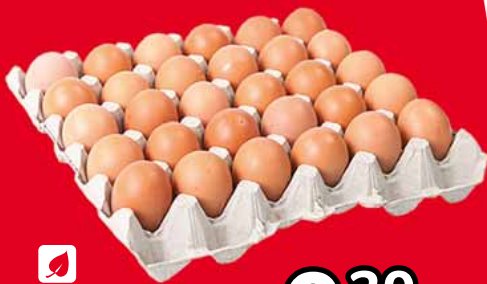
❄️ JAJA KL. L • sprzedaż po 30 szt. 55737225