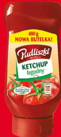
KETCHUP 480 G • wybrane rodzaje 35494939