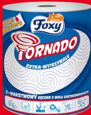
FOXY TORNADO RĘCZNIK 1 ROLKA 29252798