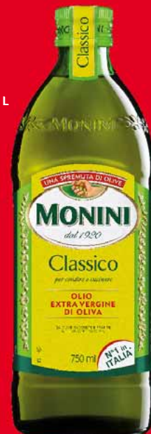
OLIWA Z OLIVEK EXTRA VERGINE 750 ML • wybrane rodzaje 32481418