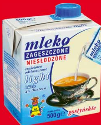
MLEKO ZAGĘSZCZONE NIESŁODZONE LIGHT 500 G 62926688