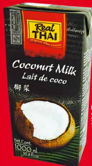
MLECZKO KOKOSOWE 1 L 33439506