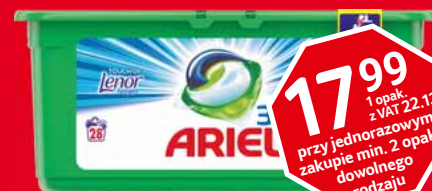
ARIEL KAPSUŁKI DO PRANIA 28 SZT. • różne rodzaje 45517281

17 99 1 opak. z VAT 22.13 przy jednorazowym zakupie min. 2 opak. dowolnego rodzaju