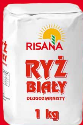
RYŻ 1 KG 72026024