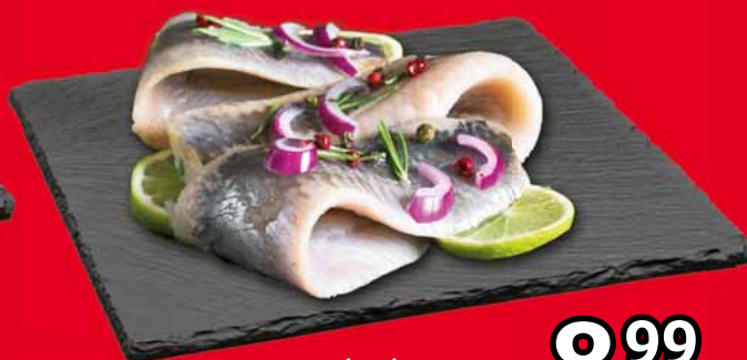
ŚLEDŹ A'LA MATIAS 99871790