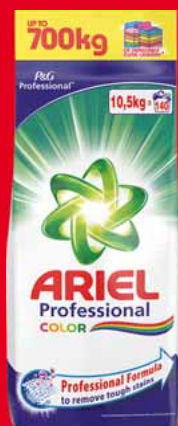
ARIEL PROSZEK 140 PRAŃ 10,5 KG • dwa rodzaje 24483950