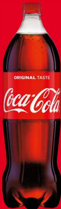
NAPOJE COCA-COLA 1,5 L • różne rodzaje 58633421