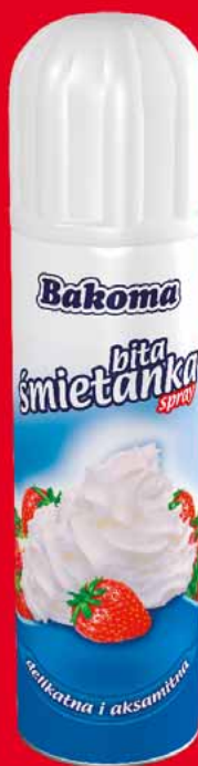
ŚMIETANA SPRAY 250 ML 42382713

0 95 1 szt. z VAT 1.00 przy jednorazowym zakupie min. 2 opak. zbiorczych