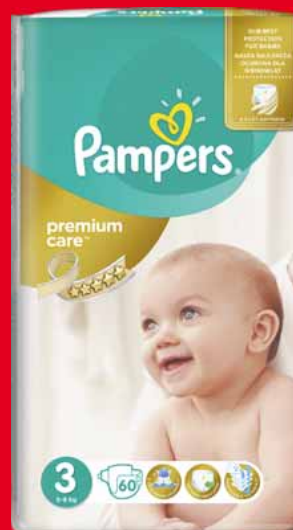
PAMPERS PREMIUM CARE PIELUSZKI, PAMPERS JUMBO PACK PIELUCHOMAJTKI • różne rodzaje 44500544