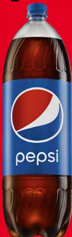
NAPOJE PEPSI 2,25 L • różne rodzaje 58825886