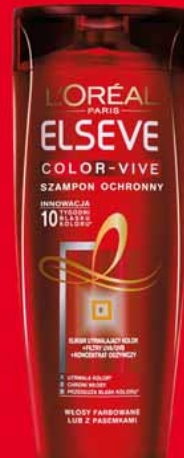
ELSEVE SZAMPON 400 ML • różne rodzaje 20176780