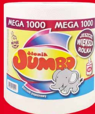
SŁONIK JUMBO MEGA RĘCZNIK 1 ROLKA 22396360