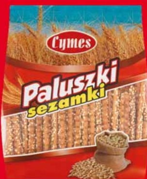
PALUSZKI Z SEZAMEM 250 G 46742219