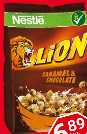
PŁATKI 500 G • wybrane rodzaje 49913619