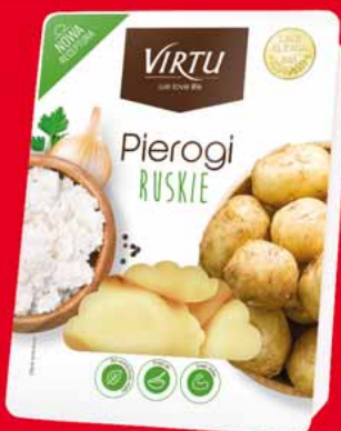
PIEROGI RUSKIE, Z SEREM, Z KAPUSTĄ I GRZYBAMI 400 G • pozostałe rodzaje pierogów również w promocyjnych cenach 64376239