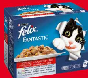
FELIX 12 x 100 G • różne rodzaje 28323368