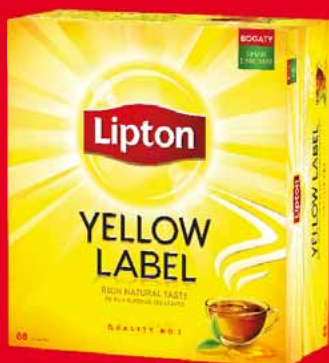
HERBATA EKSPRESOWA LIPTON YELLOW LABEL 88 TOREBEK 49775711