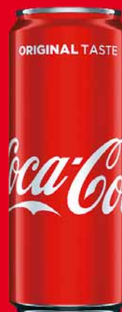
NAPOJE COCA-COLA 330 ML • różne rodzaje 83117242