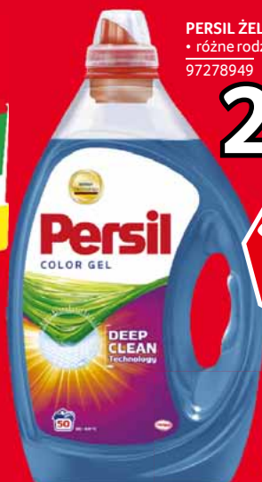
PERSIL ŻEL DO PRANIA 2,5 L • różne rodzaje 97278949