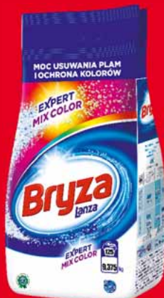
BRYZA PROSZEK 125 PRAŃ 9,375 KG • dwa rodzaje 20919395