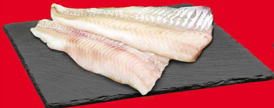
DORSZ ATLANTYCKI FILET BEZ SKÓRY 52450038