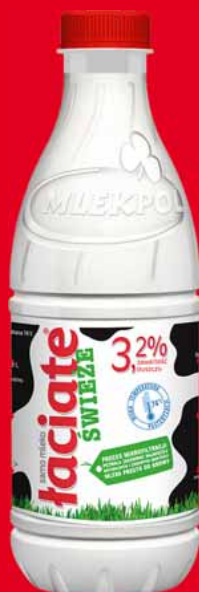
MLEKO PET 3,2% L 76231083