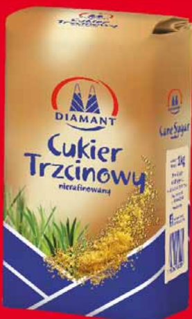
CUKIER TRZCINOWY 1 KG 77958536