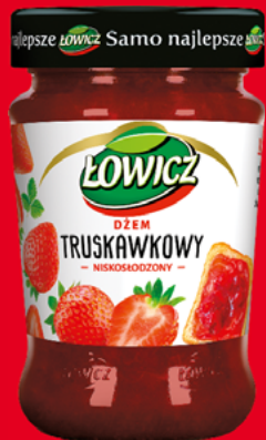
DŻEM 280 G • wybrane rodzaje 31093636