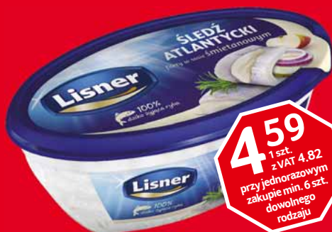
FILETY ŚLEDZIOWE W SOSACH 280 G • różne rodzaje 78464948