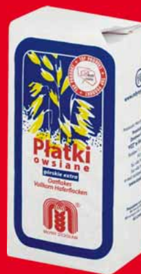
PŁATKI GÓRSKIE OWSIANE 0,5 KG 10632768