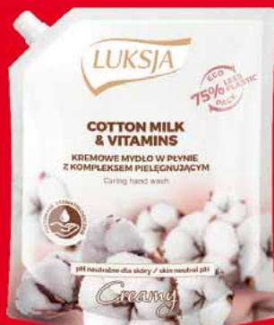
LUKSJA MYDŁO W PŁYNIE ZAPAS 900 ML • różne rodzaje 99130569