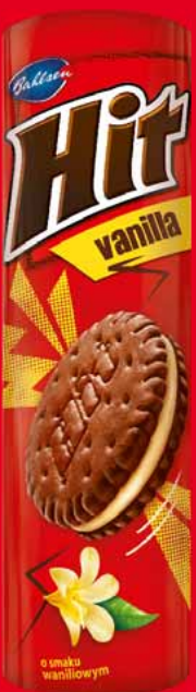
HIT 220 G • różne rodzaje 48886808

-10% przy jednorazowym zakupie min. 3 szt. jednego rodzaju