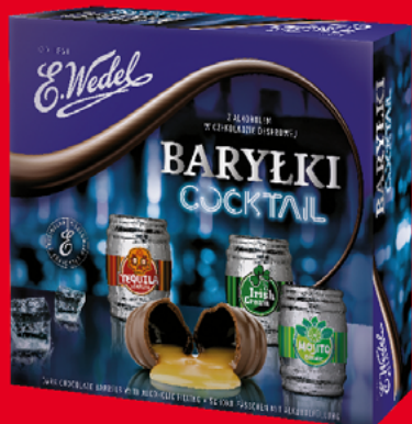
BARYŁKI 200 G • różne rodzaje 45648045