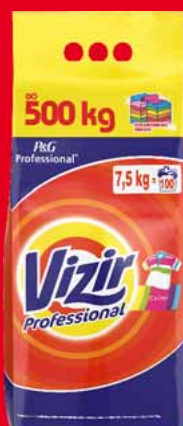
VIZIR PROSZEK 100 PRAŃ 7,5 KG • dwa rodzaje 35701283