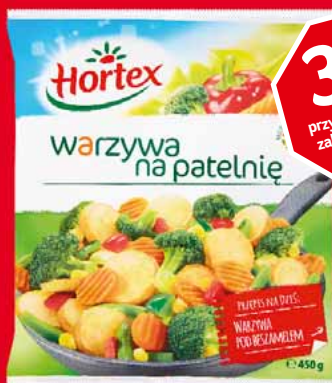
❄️ WARZYWA NA PATELNIĘ 400/450 G • różne rodzaje 99939647