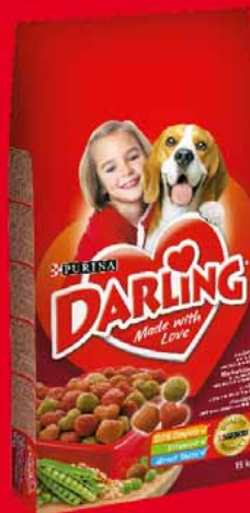
DARLING 15 KG • dwa rodzaje 61029781