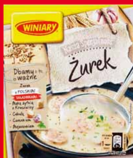
ZUPA • barszcz biały/czerwony, żurek 52583606