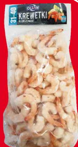
❄️ KREWETKA BIAŁA 31-40 0,8/1 KG 48170849