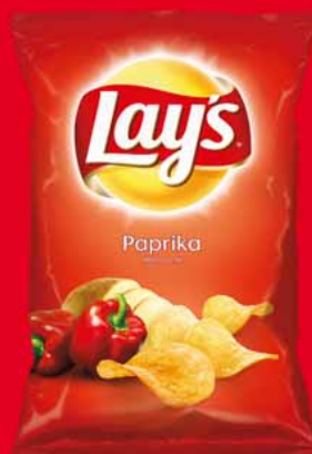
LAY'S 125/140 G • różne rodzaje 42452631