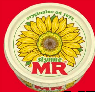
SŁYNNE MR ROŚLINNE 500 G 91441832