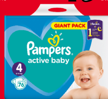
PAMPERS ACTIVE GIANT PACK PIELUSZKI • różne rodzaje 39538723