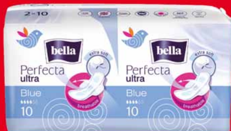
BELLA PERFECTA ULTRA DUO PODPASKI • różne rodzaje 30033062