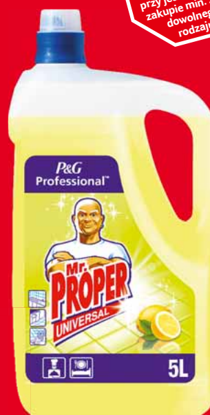
MR. PROPER PŁYN UNIERSALNY 5 L • różne rodzaje 11556131

21 59 1 szt. z VAT 26.56 przy jednorazowym zakupie min. 2 szt. dowolnego rodzaju