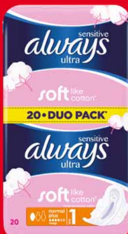
ALWAYS ULTRA DUO PODPASKI • różne rodzaje 43577741