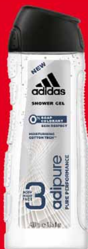
ADIDAS ŻEL POD PRYSZNIC 400 ML • różne rodzaje 45542081