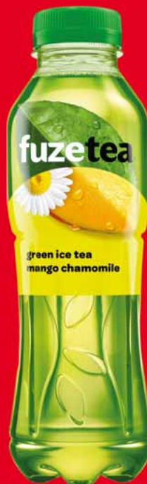
NAPOJE FUZETEA 500 ML • różne smaki 45787603