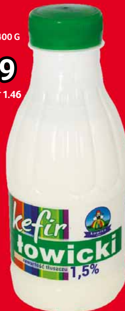
KEFIR 1,5% 400 G 69180644