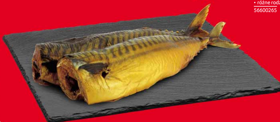
MAKRELA TUSZA WĘDZONA DUŻA 61481230