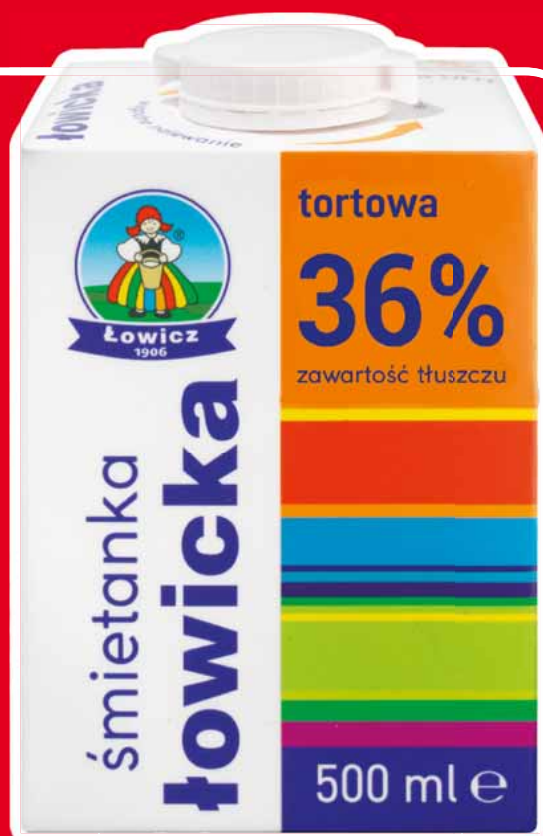
ŚMIETANKA UHT 36% 500 G 24219727