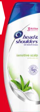
HEAD & SHOULDERS SZAMPON 360 ML, 400 ML • różne rodzaje 75482695