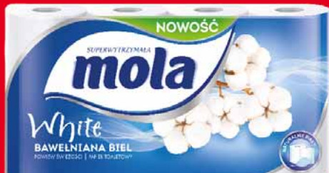
MOLA PAPIER TOALETOWY 8 ROLK • różne rodzaje 15926116