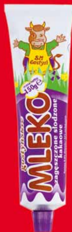
MLEKO ZAGĘSZCZONE SŁODZONE 150 G • różne smaki 80025273