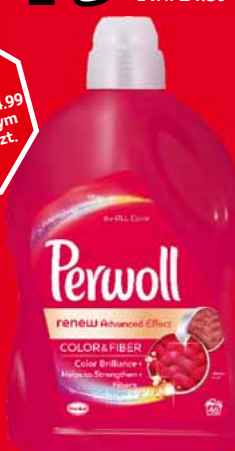
PERWOLL PŁYN DO PRANIA 2,7 L • różne rodzaje 97540686

12 19 1 szt. z VAT 14.99 przy jednorazowym zakupie min. 2 szt. dowolnego rodzaju