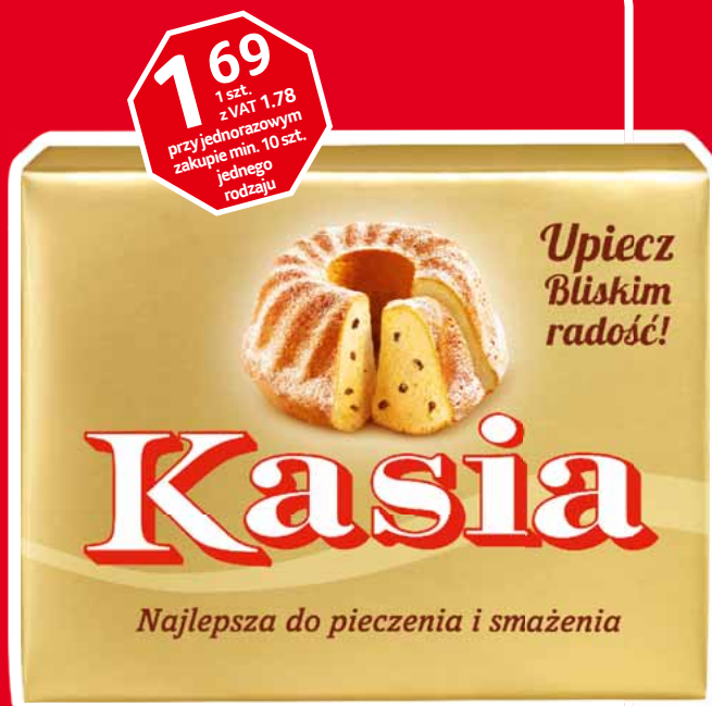
KASIA 250 G • wybrane rodzaje 91616375

1 69 1 szt. z VAT 1.78 przy jednorazowym zakupie min. 10 szt. jednego rodzaju