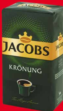
KAWA MIELONA JACOBS KRÖNUNG 500 G 47230859