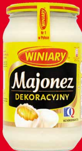
MAJONEZ DEKORACYJNY 700 ML 59060483