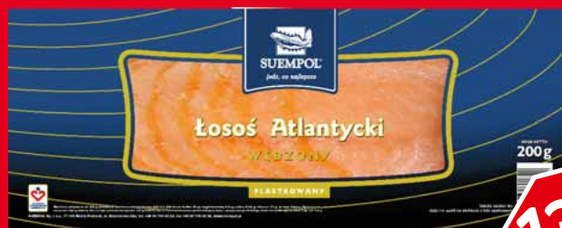
ŁOSOŚ WĘDZONY PLASTRY 200 G 79421913