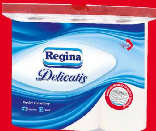
REGINA DELICATIS PAPIER TOALETOWY 9 ROLK 23970064