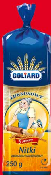
MAKARON LUKSUSOWY NITKI 250 G 22209928