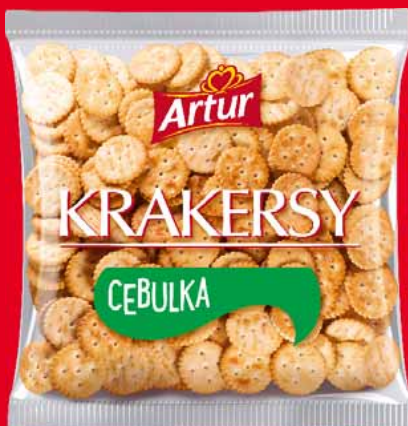
KRAKERSY 90 G • klasyczne, cebulowe 49586233