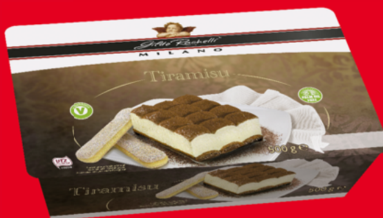
DESER TIRAMISU 500 G, PROFITEROLES 450 G 31037088