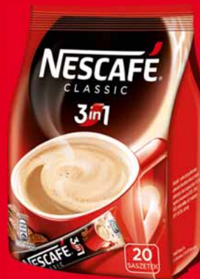
NESCAFÉ CLASSIC 2 W 1 10 G, 3 W 1 18 G • sprzedaż po 20 szt. 90810011