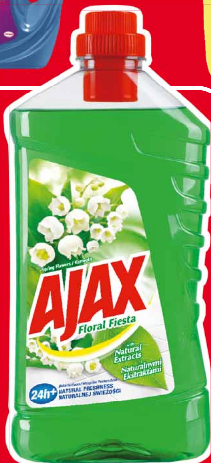
AJAX PŁYN UNIERSALNY 5 L • różne rodzaje 42347559