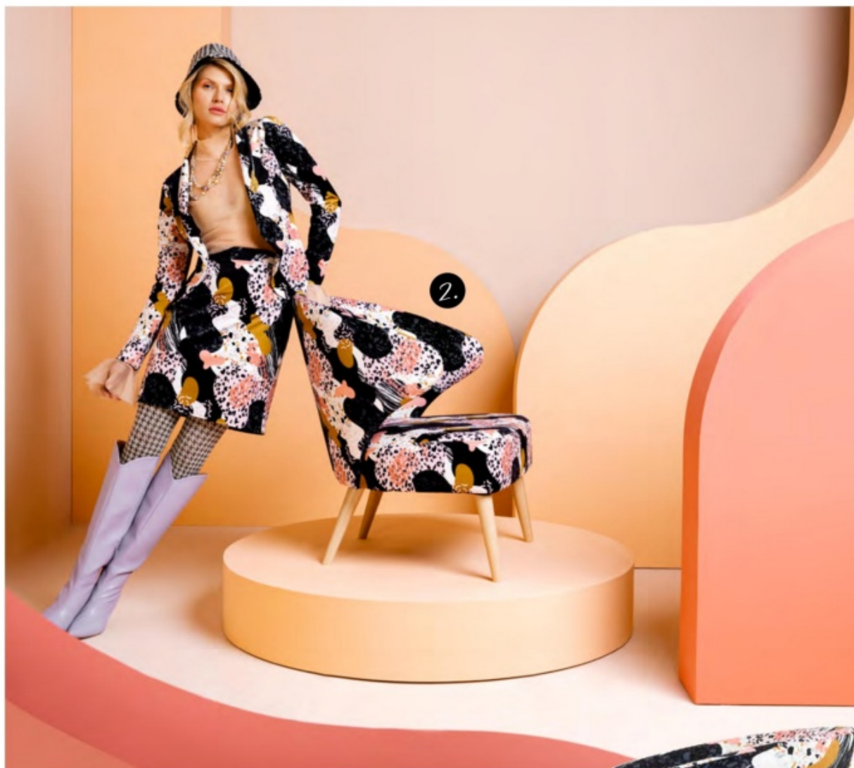
1. puf Emily, 2. fotel Garita