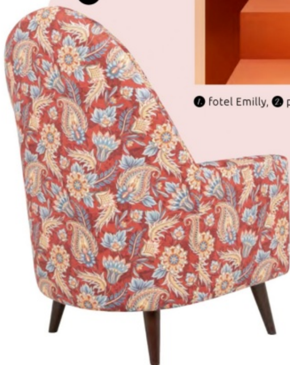
1 fotel Emily, 2 puf Emily