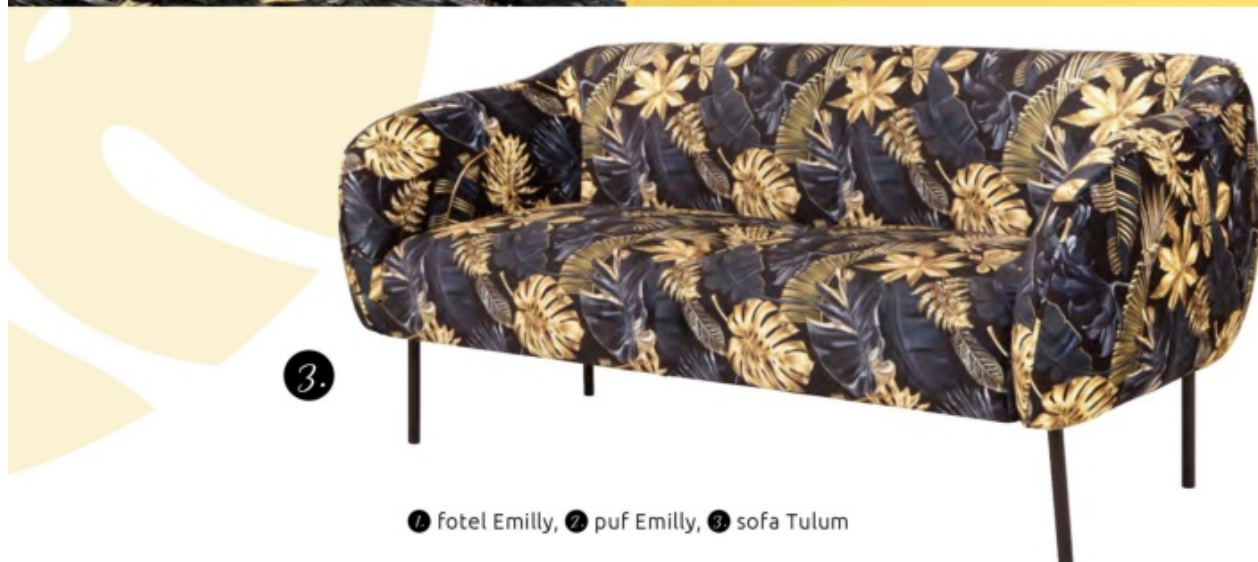
1 fotel Emily, 2 puf Emily, 3 sofa Tulum