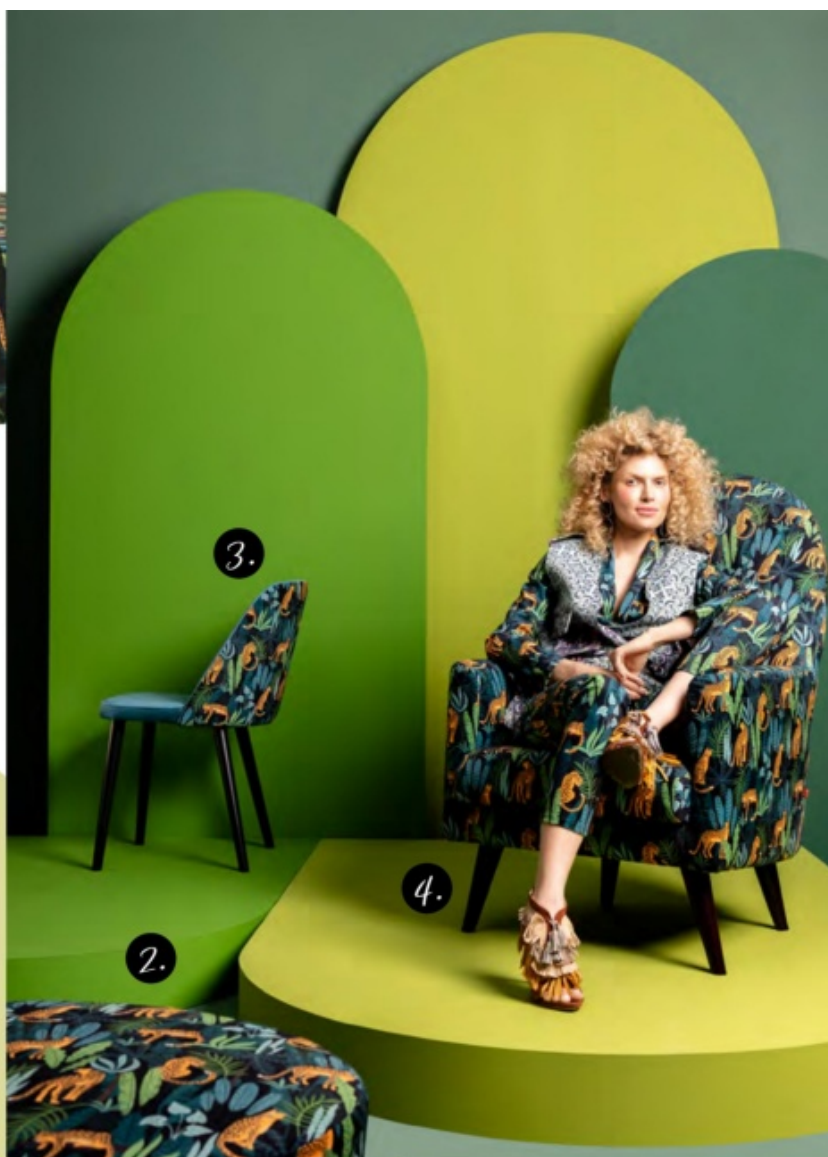
1. fotel Garita, 2. puf Lafu, 3. krzesło Aka, 4. fotel Emily