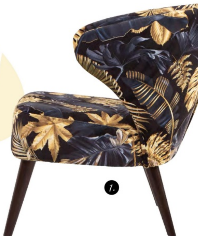
1 fotel Garita, 2 krzesło Aka, 3 puf Lafu