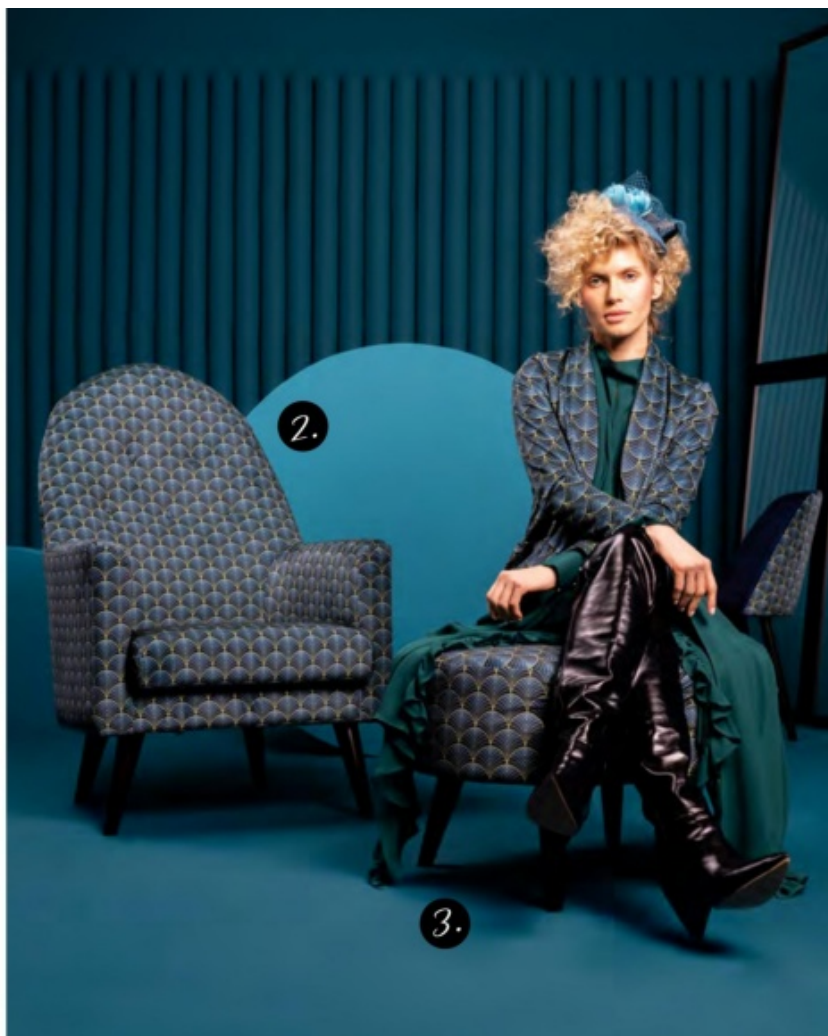
1 krzesło Aka, 2 fotel Emily, 3 puf Emily