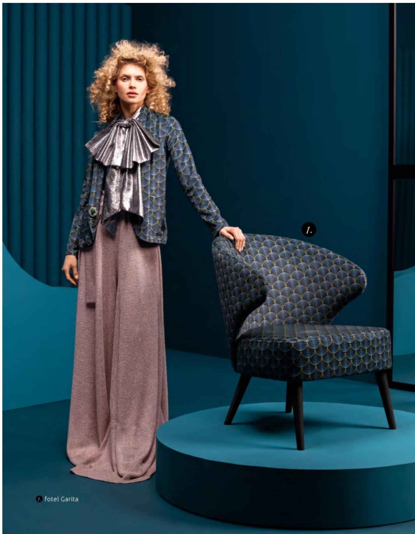
1. fotel Garita