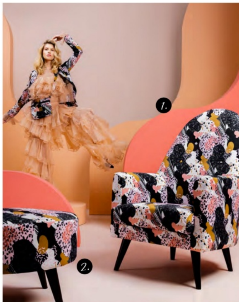
1. fotel Emily, 2. puf Emily, 3. krzesło Aka

S praw, by Twoje wnętrze było inne niż wszystkie - postaw na odważne, abstrakcyjne printy i poczuć wielką moc designu. Abstrakcja to różnorodność form i barw, kontrasty i wyraziste linie. Przełamuj schematy i baw się kolorem, kształtem i wzorem. Wnętrze pełne barw i dynamicznych form to propozycja dla prawdziwych indywidualistów.