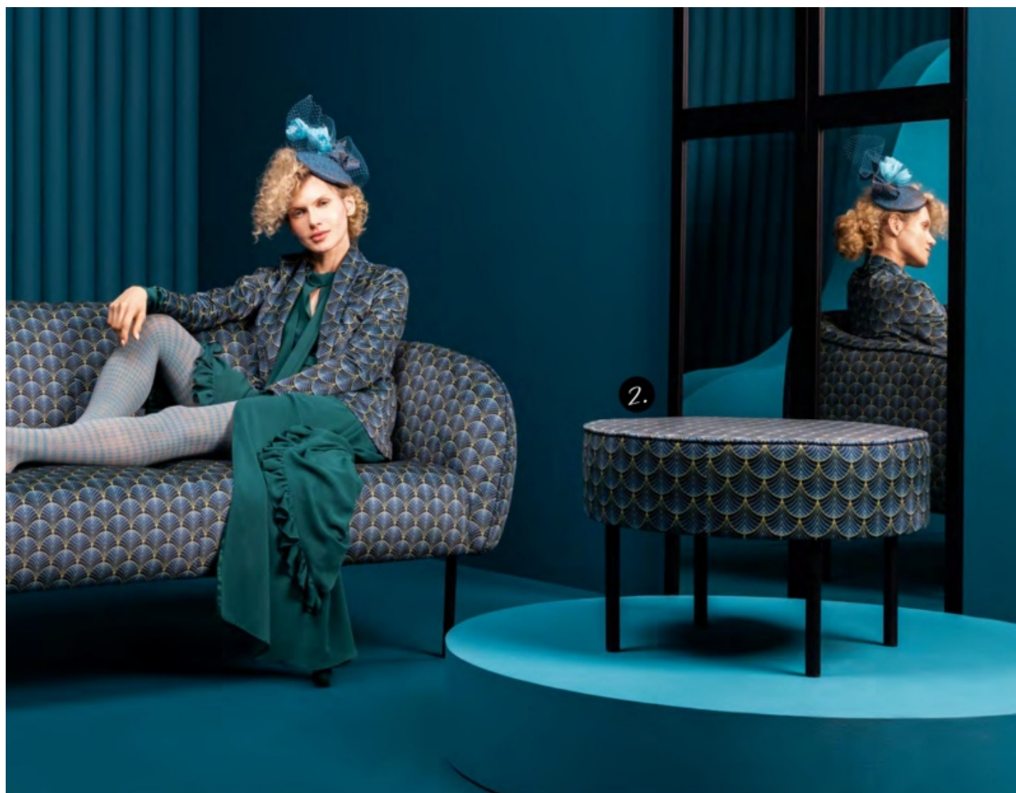
1 sofa Tulum, 2 puf Lafu