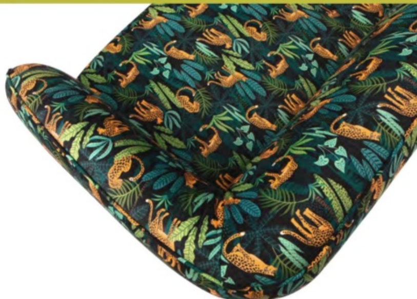
1 sofa Tulum