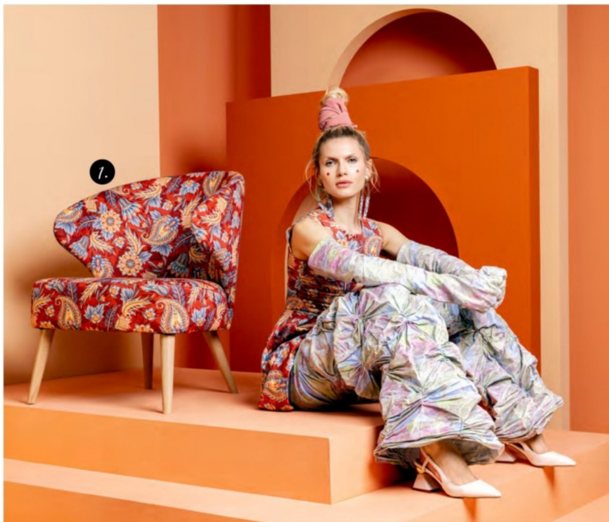
1 fotel Garita