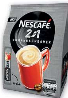
Kawa rozpuszczalna Nescafe 2w1 80 g; 8,11 zł/100 g NESTLE