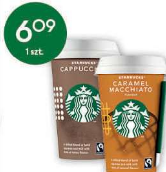
Napój Starbucks wybrane rodzaje 220-250 ml; 24,36-27,68 zł/1 l ARLA FOODS