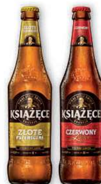
Piwo Książęce wybrane rodzaje, butelka zwrotna 500 ml; 5,98 zł/1 l