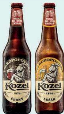
Piwo Kozel wybrane rodzaje, butelka zwrotna 500 ml; 5,38 zł/1 l