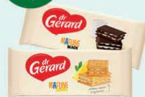
Herbatniki Mafijne wybrane rodzaje 199-216 g; 13,38-14,52 zł/1 kg DR GERARD