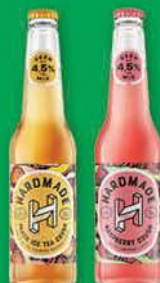
Piwo Hardmade wybrane rodzaje butelka bezzwrotna 400 ml; 8,73 zł/1 l