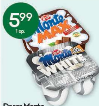
Deser Monte wybrane rodzaje 4x100 g; 14,98 zł/1 kg ZOTT