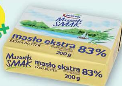
Masło extra Mazurski Smak 200 g; 22,95 zł/1 kg SM MLEKPOL