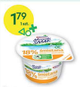
Śmietana 18% Mazurski Smak 200 g; 8,95 zł/1 kg SM MLEKPOL