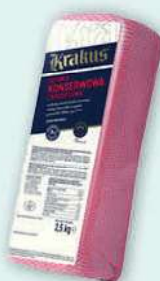
Szynka Konserwowa cena za kilogram KRAKUS