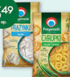
Chrupki, prazyńki Przysnacki wybrane rodzaje 110-150 g; 23,27-31,73 zł/1 kg INTERSNACK