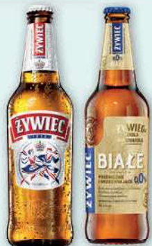
Piwo Żywiec wybrane rodzaje, butelka zwrotna 500 ml; 4,98 zł/1 l