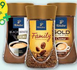
Kawa rozpuszczalna Tchibo Black&White Crema, Gold Selection Crema, Family 180-200 g; 79,95-88,83 zł/1 kg TCHIBO