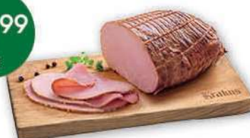
Szynka Krucha cena za kilogram KRAKUS