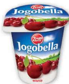
Jogurt Jogobella wybrane rodzaje 150 g; 7,27 zł/1 kg ZOTT

Cena standardowa: 09-11.09.2021 2 99 1 szt. zupelny HIT