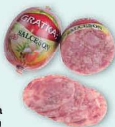
Salceson Gratka cena za kilogram SOKOŁÓW