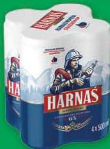
Piwo Harnaś 4x500 ml; 4,50 zł/1 l