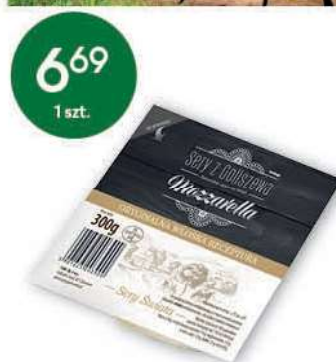
Ser Mozarella 300 g; 22,30 zł/1 kg CEKO