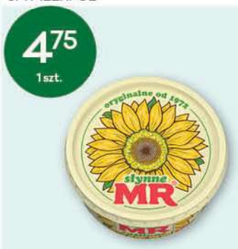
Słynne MR roślinne 500 g; 9,50 zł/1 kg ZT KRUSZWICA