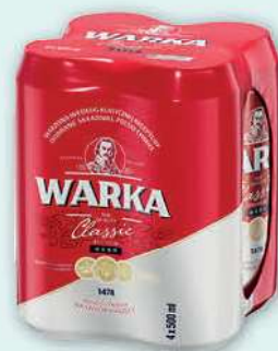
Piwo Warka 4x500 ml; 5,30 zł/1 l