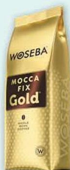
Kawa ziarnista Mocca Fix Gold 500 g; 33,98 zł/1 kg WOSÉBA