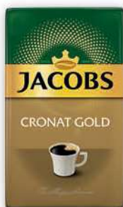
Kawa mielona Jacobs Cronat Gold 500 g; 30,98 zł/1 kg JACOBS DOUWE EGBERTS