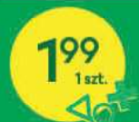
Serek topiony wybrane rodzaje 100 g SM MLEKPOL