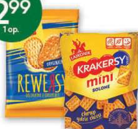
Krakersy Mini, Rewersy wybrane rodzaje 95-100 g; 2,99-3,15 zł/100 g THE LORENZ BAHLEN