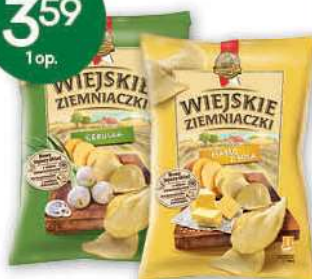
Chipsy Wiejskie Ziemniaczki wybrane rodzaje 110-130 g; 27,62-32,64 zł/1 kg THE LORENZ BAHLEN