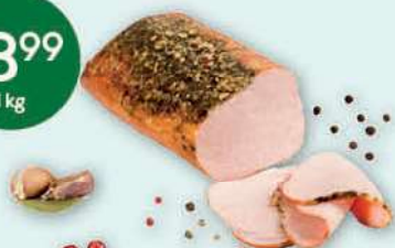
Schab pieczony cena za kilogram DUDA