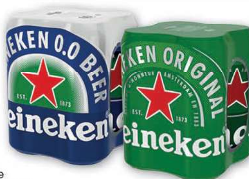
Piwo Heineken wybrane rodzaje 4x500 ml; 6,00 zł/1 l