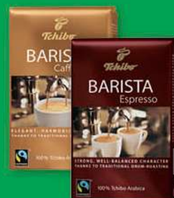
Kawa ziarnista Tchibo Barista Espresso, Cafe Crema 500 g; 51,98 zł/1 kg TCHIBO