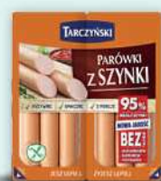
Parówki z szynki 220 g, z fileta kurczaka 180 g 220 g; 22,68-27,72 zł/1 kg TARCZYŃSKI