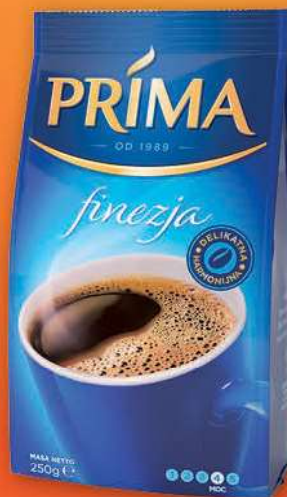
Kawa mielona Prima Finezja 250 g; 27,96 zł/1 kg JACOBS DOUWE EGBERTS