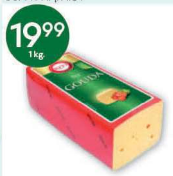
Ser żółty Gouda 1 kg SM RYKI