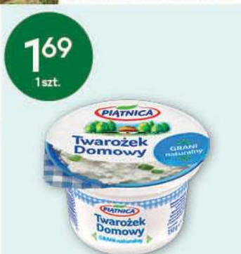
Twarożek domowy 150 g; 11,27 zł/1 kg OSM W PIĄTNICY