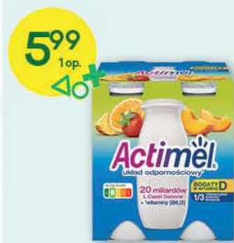
Actimel wybrane rodzaje 4x100 g; 14,98 zł/1 kg DANONE