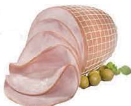
Szynka Gotowana cena za kilogram DOBROWOLSCY