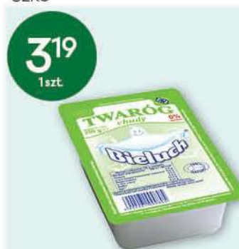
Twaróg Bieluch wybrane rodzaje 250 g; 12,76 zł/1 kg SM BIELUCH