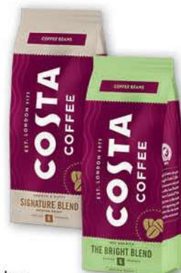
Kawa ziarnista Costa Coffee wybrane rodzaje 200 g; 49,95 zł/1 kg COCA COLA