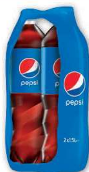
Napój Pepsi, Mirinda wybrane rodzaje 2x1,5 l; 3,00 zł/1 l FRITO LAY

1/2 LITRA PIWA ZAWIERA 25 GRAMÓW CZYSTEGO ALKOHOLU ETYLOWEGO