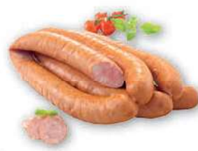
Kielbasa Podwawelska cena za kilogram SOKOŁÓW