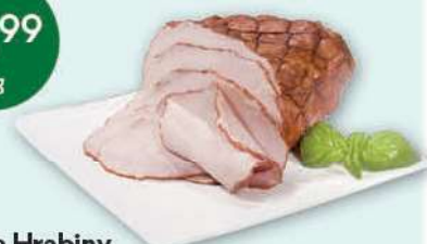
Szynka Hrabiny cena za kilogram DOBROWOLSCY