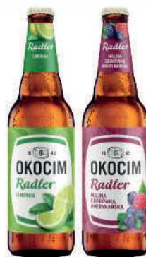
Piwo Okocim Radler wybrane rodzaje, butelka zwrotna 500 ml; 5,98 zł/1 l