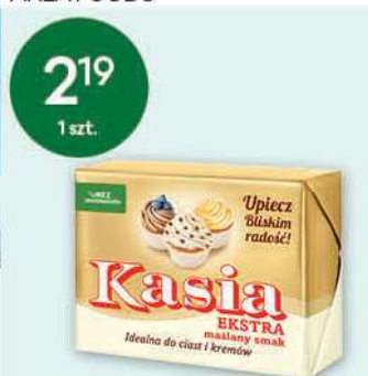
Margaryna Kasia wybrane rodzaje 250 g; 8,76 zł/1 kg UPFIELD