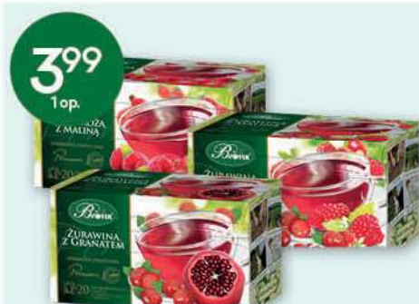
Herbata ekspresowa owocowa Bifix wybrane rodzaje 20 torebek BIFIX