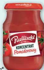
Koncentrat pomidorowy Pudliszki wybrane rodzaje 195-200 g; 14,95-15,33 zł/1 kg* 16,45-16,87 zł/1 kg (cena standardowa) HJ HEINZ