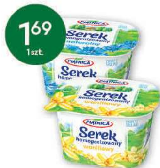
Serek homogenizowany wybrane rodzaje 150 g; 11,27 zł/1 kg OSM W PIĄTNICY