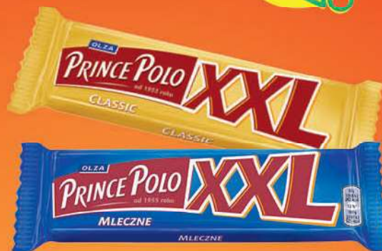
Wafel Prince Polo wybrane rodzaje 50 g; 2,30 zł/100 g MONDELEZ