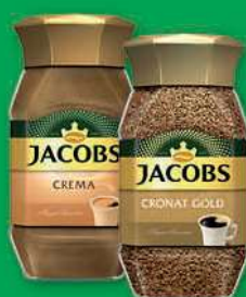
Kawa rozpuszczalna Jacobs Cronat Gold, Crema 200 g; 99,95 zł/1 kg JACOBS DOUWE EGBERTS