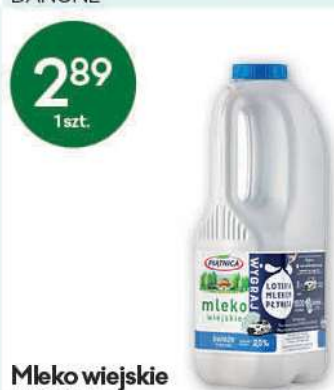
Mleko wiejskie 2% PET 1 l OSM W PIĄTNICY