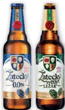
Piwo Zatecky wybrane rodzaje, butelka zwrotna 500 ml; 5,58 zł/1 l