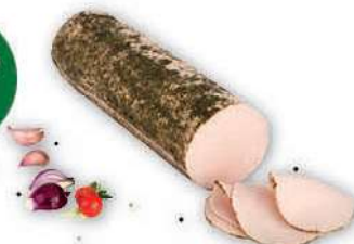
Polędwica Drobiowa z Majerankiem cena za kilogram DUDA