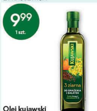
Olej kujawski 3 ziarna 750 ml; 13,32 zł/1 l ZT KRUSZWICA