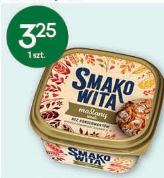
Margaryna Smakowita wybrane rodzaje 180-450 g; 7,22-18,06 zł/1 kg ZT KRUSZWICA