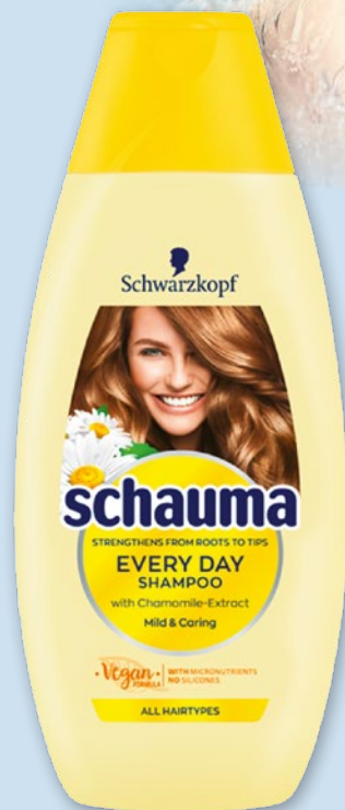
SCHAUMA SZAMPON 400 ML • różne rodzaje 11118650