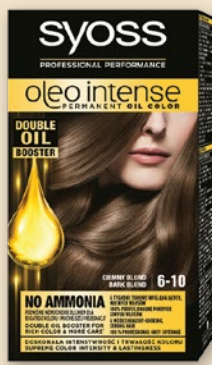
SYOSS KREM KOLORYZUJĄCY • różne rodzaje 38810677