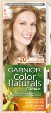
GARNIER FARBA DO WŁOSÓW • różne rodzaje 21738273