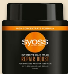
SYOSS MASKA 500 ML • różne rodzaje 42449520