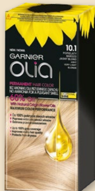
GARNIER OLIA FARBA DO WŁOSÓW 74339946