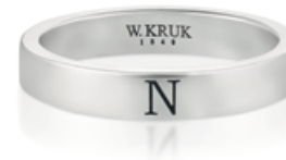
2. pierścione WWK/PS1328 - srebro 299 zł 3. pierścione WWK/PS1327 - srebro 179 zł