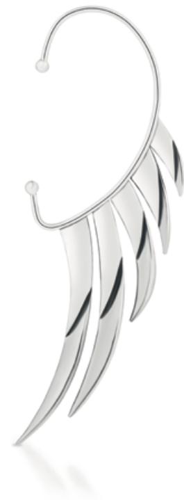
zausznica WWK/KS1320 - srebro 299 zł