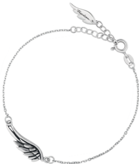
bransoleta WWK/AS1324 - srebro 129 zł