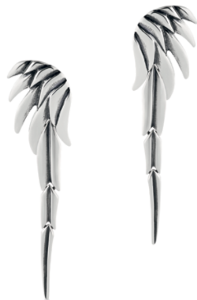
kolczyki WWK/KS1319 - srebro 349 zł