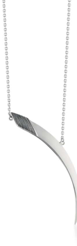
naszyjnik WWK/NS1322 - srebro 399 zł