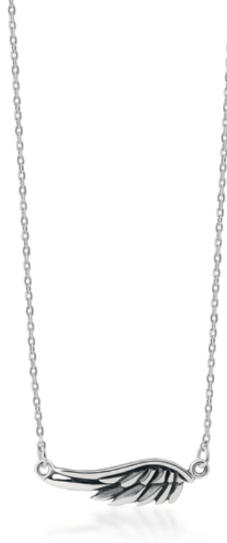
naszyjnik WWK/NS1324 - srebro 179 zł