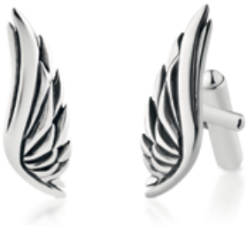
spinki do mankietów WWK/MS1327 - srebro 299 zł