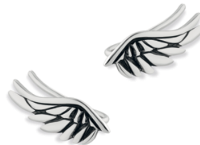
nausznice WWK/KS1324 - srebro 149 zł