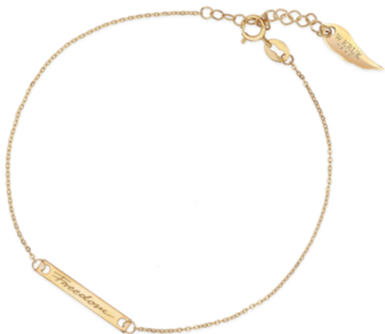
bransoleta XWK/AZ64 - żółte złoto 349 zł