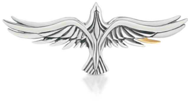
broszka WWK/BS1319 - srebro z elementem pozłacanym 349 zł