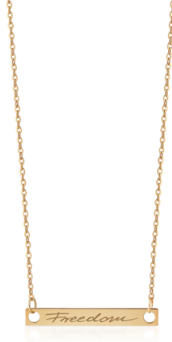
naszyjnik XWK/NZ64 - żółte złoto 449 zł