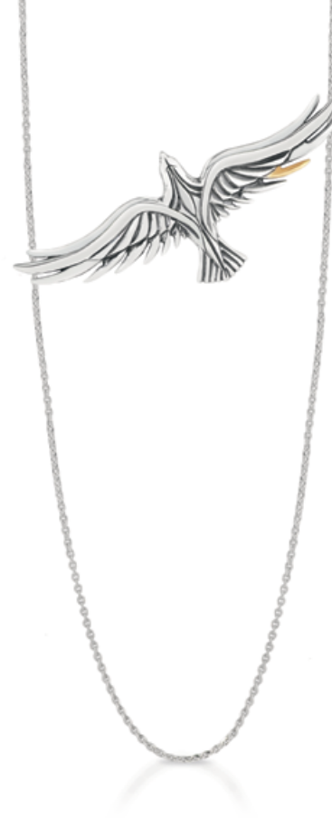
naszyjnik WWK/NS1319 - srebro z elementem pozłacanym 399 zł