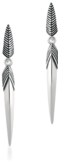
kolczyki WWK/KS1321 - srebro 179 zł